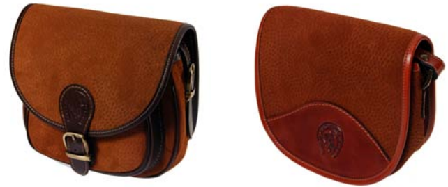
Carteras confeccionadas en cuero vacuno y cuero grabado carpincho. Interior forrado. Guantera.

Medida aprox.: Chica 17 cm x 13 cm x 6 cm. Mediana 20 cm x 17 cm x 7 cm. Grande 24 cm x 20 cm x 12 cm.