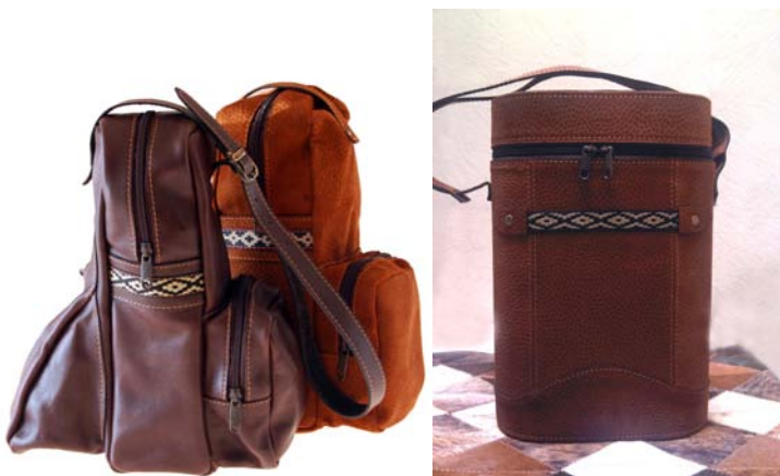
Bolsos porta termo confeccionados en cuero gamuzón o cuero flor. Bolsillos con cierre. Flexibles y rígidos.

Medida aprox.: Chica 17 cm x 13 cm x 6 cm. Mediana 20 cm x 17 cm x 7 cm. Grande 24 cm x 20 cm x 12 cm.