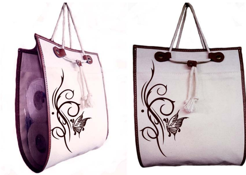
Porta rollo de papel confeccionado en tela panamá con terminaciones en eco cuero color suela, contiene divisiones y sogas trenzadas.