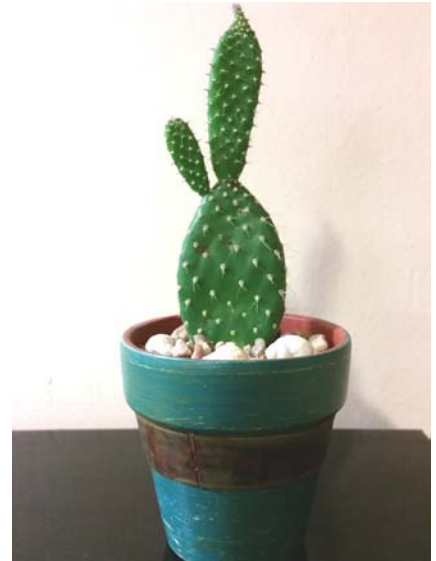
Cactus naturales. Macetas pintadas a mano tamaño nº 8 y nº 10

Completa el kit el juego Tangram. Presentados en caja de madera con la solución de ambos desafíos.