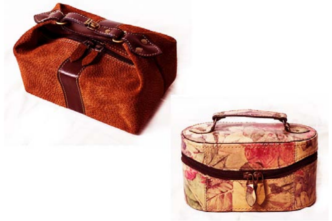
Necessaire de viaje confeccionado en cuero gamuzón o cuero flor. Interior forrado. Flexibles y rígidos.