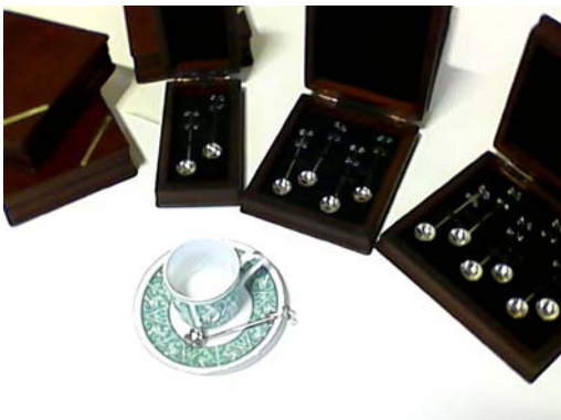
Set de cucharitas de té realizadas en alpaca totalmente a mano. Presentadas en cajas de 2, 4 ó 6 unidades.