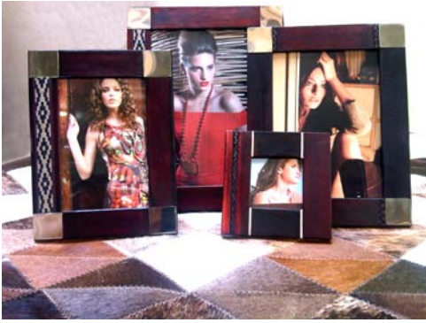
Portarretratos en madera y revestidos en cuero vaqueta. Con apliques de alpaca, guardapampa y tiento. Pirograbados. Para fotos de 10x15, 13x18 y 15x21cm.