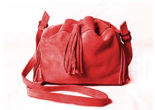
Cartera marinera en cuero gamuzón. Con flecos. Diferentes tonalidades.